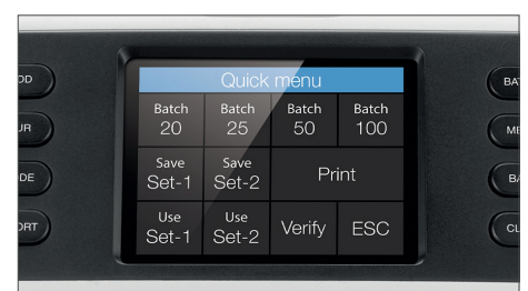
Touch screen di grandi dimensioni con menù rapido e tastierino numerico