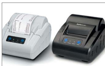
Stampante termica Safescan TP-230 N. art.: 134-0475 grigia N. art.: 134-0535 nera